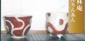
薫林庵 くんだりんあん

お洒落な器・楽しい器・和の器 全国から集めた個性的な器です。 定休日は月・火・水