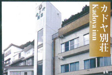
カドヤ別荘 Kadoya inn

癒しの和空間と、安らぎの天然岩風呂、きじ鍋、いのぶた鍋も好評。故郷の息吹に触れる情緒ある旅館です。