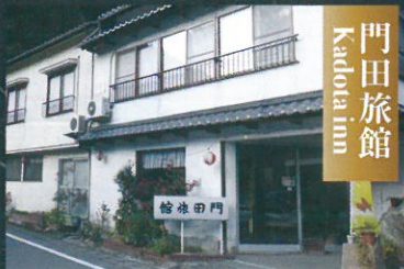
門田旅館 Kadota inn

TEL 0898-55-2360 http://www.mikado-nibukawa.ehime.jp/