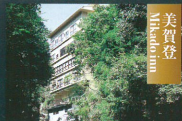
美賀登 Mikado inn

自然美彩る渓流沿いに佇む静かな和宿。～やど日本～日本旅館協会会員 wi-fi完備