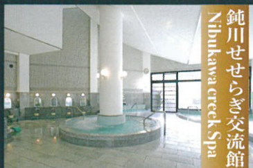
鈍川せせらぎ交流館 Nibukawa creek Spa

有馬温泉(兵庫) / pH8.5 草津温泉(群馬) / pH2.0 下呂温泉(岐阜) / pH9.2